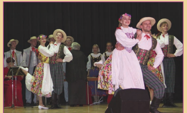
Gala Kresowa w Domu Kultury