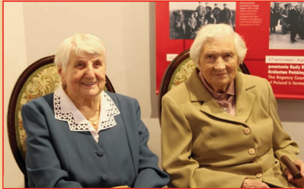
"Drogi do Niepodległej" w Muzeum Regionalnym