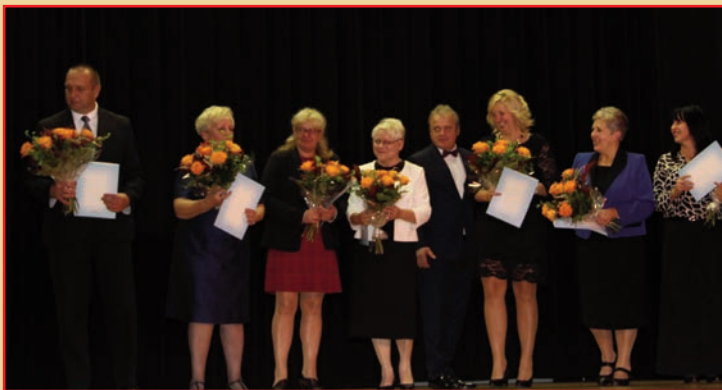
Dzień Edukacji Narodowej w Chojnowie