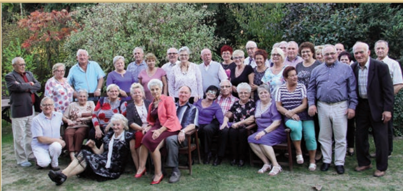
Emerycy przywitali jesień!