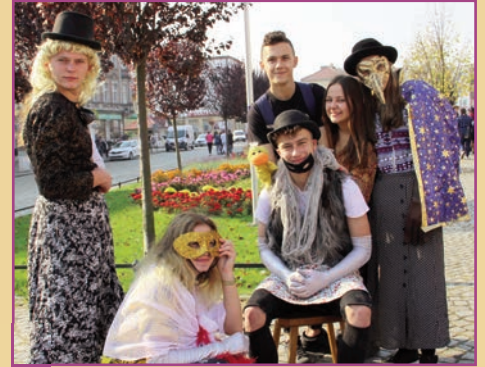
Festiwal Wielu Kultur w Chojnowie - PZS