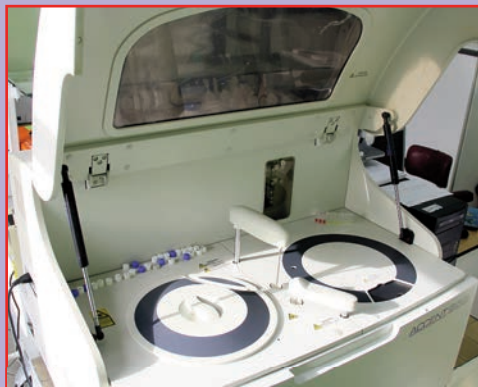
Nowe urządzenia w laboratorium Przychodni Rejonowej

NR 20 (914) ROK XXVI 09.11.2018 CENA 1,70 zł