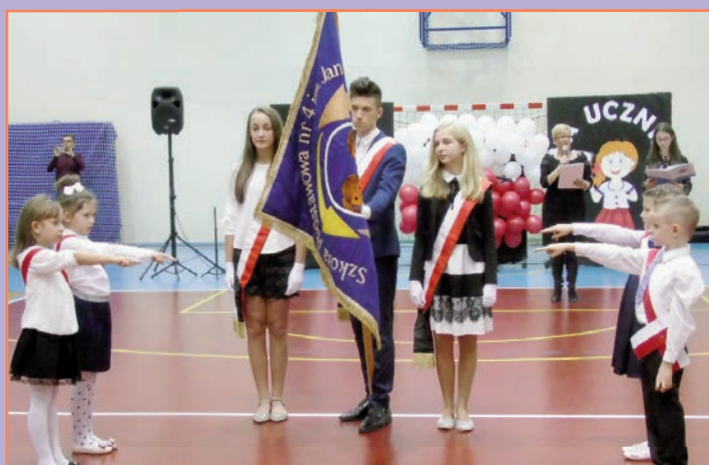
Szkoła Podstawowa nr 4