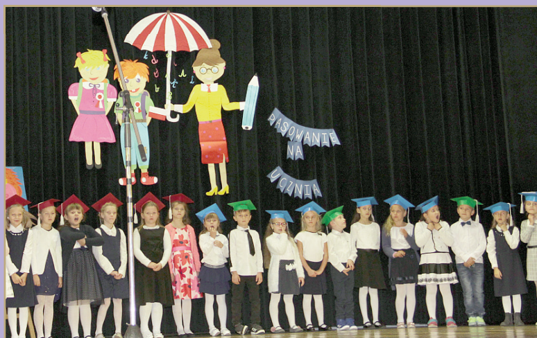
Szkoła Podstawowa nr 3