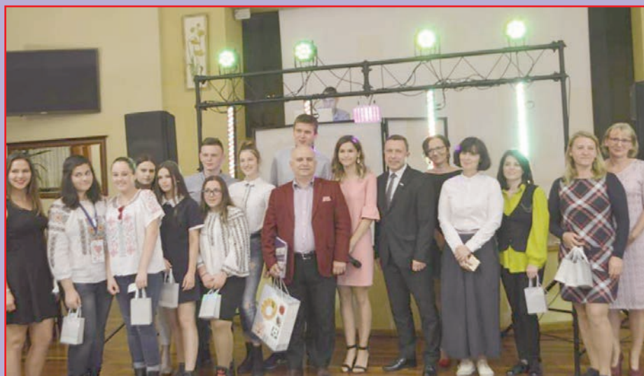
Goście z Europy z wizytą w Powiatowym Zespole Szkół