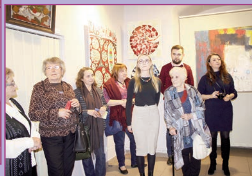
„Licencja na sztukę. Regionalne zderzenia estetyczne” - wystawa w Muzeum Regionalnym