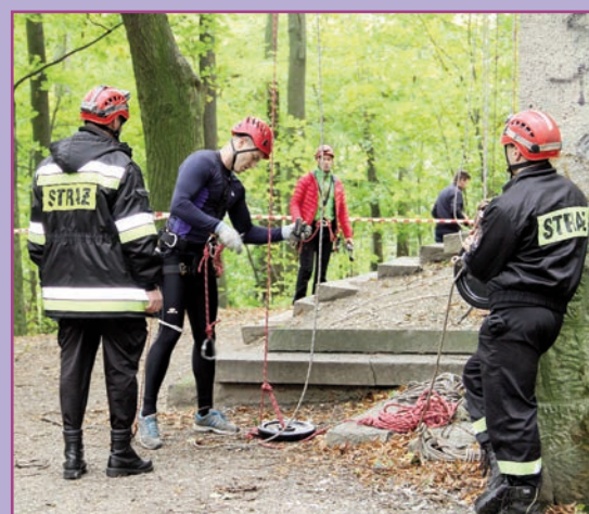
XVII Otwarte Mistrzostwa Województwa Dolnośląskiego Strażaków w Ratownictwie Wysokościowym