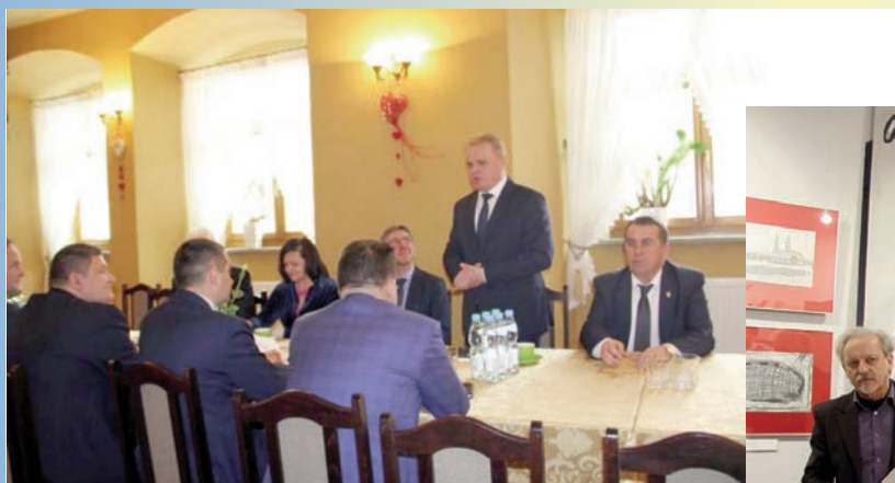
Konwent burmistrzów i wójtów powiatu legnickiego w Chojnowie