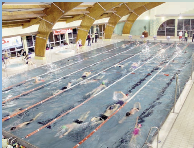
Ogólnopolski Nocny Maraton Pływania „Otyliada 2019”