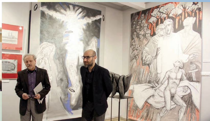
Wystawa Grzegorza Niemyjskiego pt. „Jutrznia” w Muzeum Regionalnym