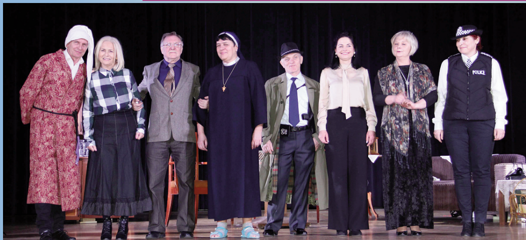
O kobiecej sile, troszkę inaczej... „Upiór w kuchni” grupy teatralnej Antykwariat