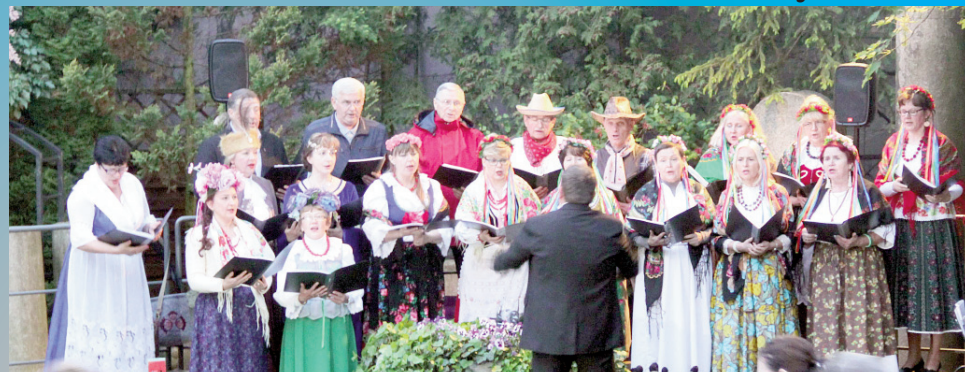
VIII Noc Muzeów