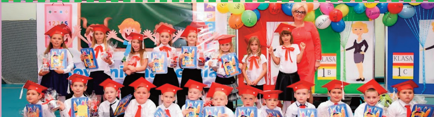
Szkoła Podstawowa nr 4 im. Janusza Korczaka