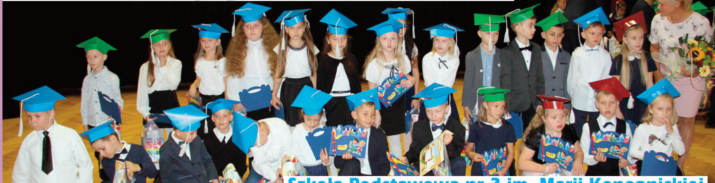
Szkoła Podstawowa nr 3 im. Marii Konopnickiej