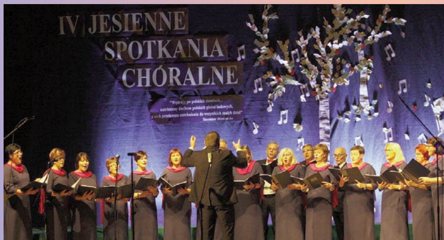
Skoranta na IV Jesiennych Spotkaniach Chóralnych w Lubaniu