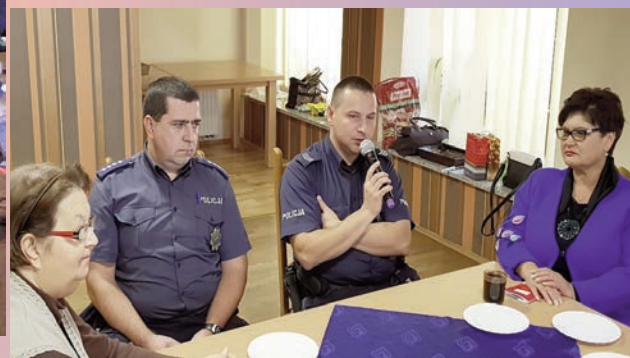
Pogadanka o bezpieczeństwie