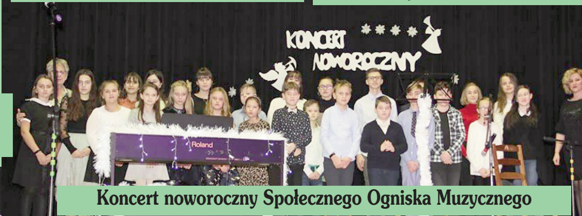
Koncert noworoczny Społecznego Ogniska Muzycznego