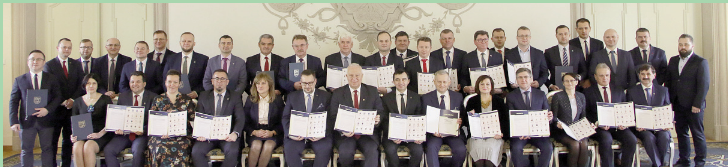
Chojnowo akcjonariuszem deklaracji o współpracy