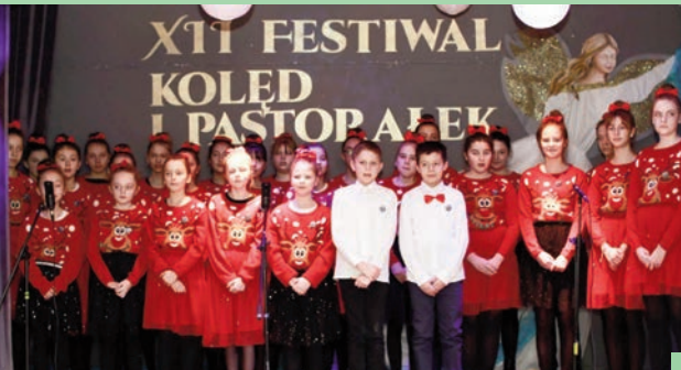
Wyśpiewany sukces chóru Allegro