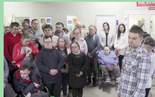
Malujemy samodzielnie i z pomocą - wystawa w MBP