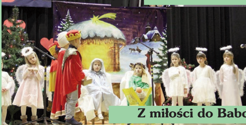
Z miłości do Babci i Dziadka