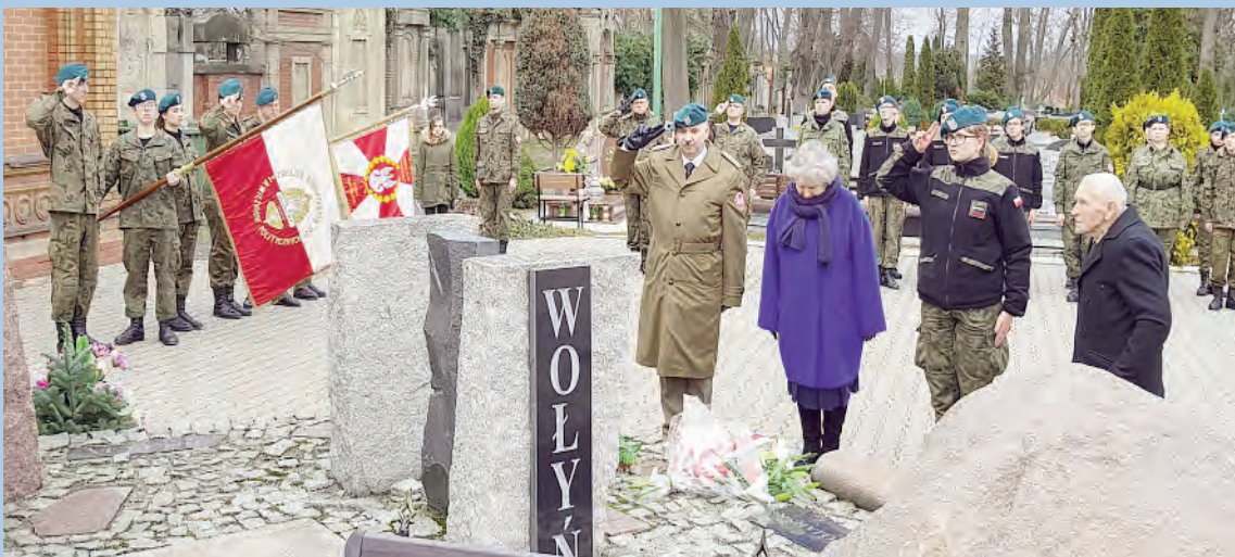
V Strzeleckie Zgrupowanie Szkoleniowe