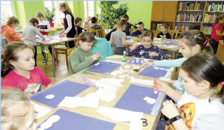
Ferie z MBP