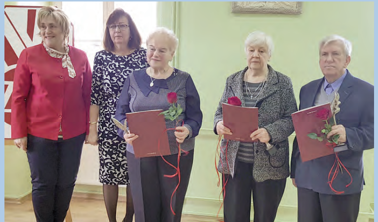
„Wśród przyjaciół” – uroczystość ZNP