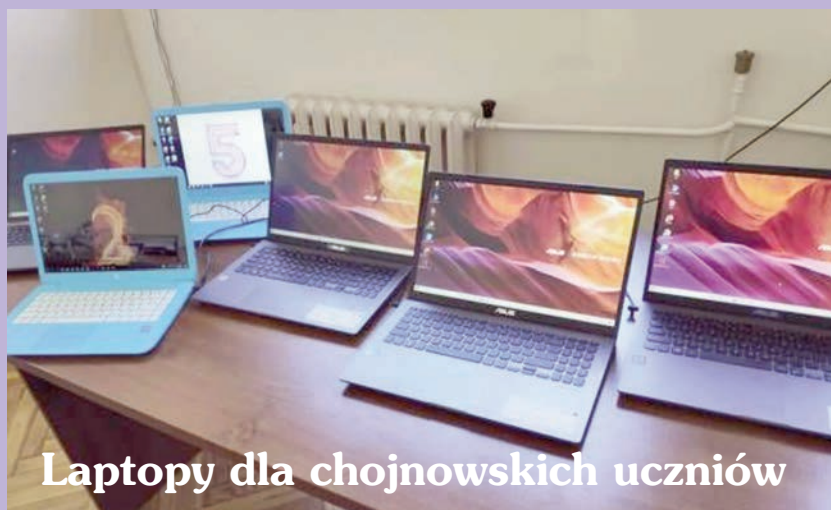
Laptopy dla chojnowskich uczniów