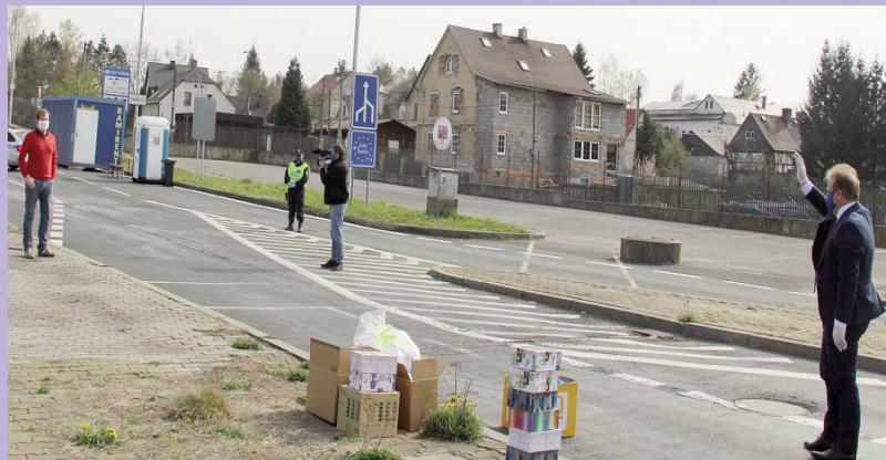
Mnichovo Hradiště dla Chojnowa