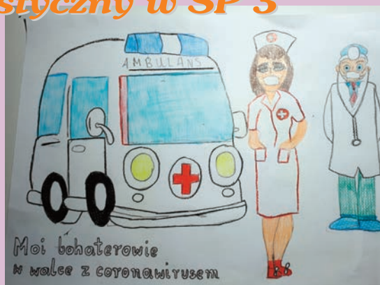
Moi bohaterowie w walce z koronawirusem