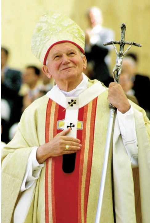
Setna rocznica urodzin św. Jana Pawła II „Co Mi w duszy gra” cz. 2

NR 10 (950) ROK XXVIII 22.05.2020 CENA 1,70 zł