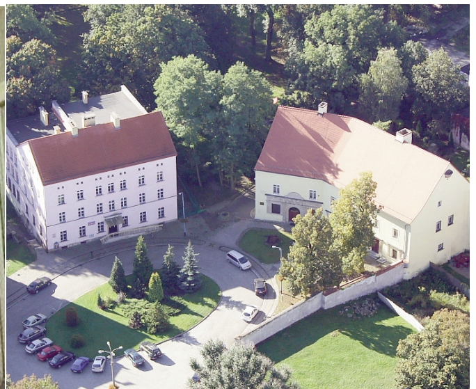
Miejska Biblioteka Publiczna i Muzeum Regionalne otwarte