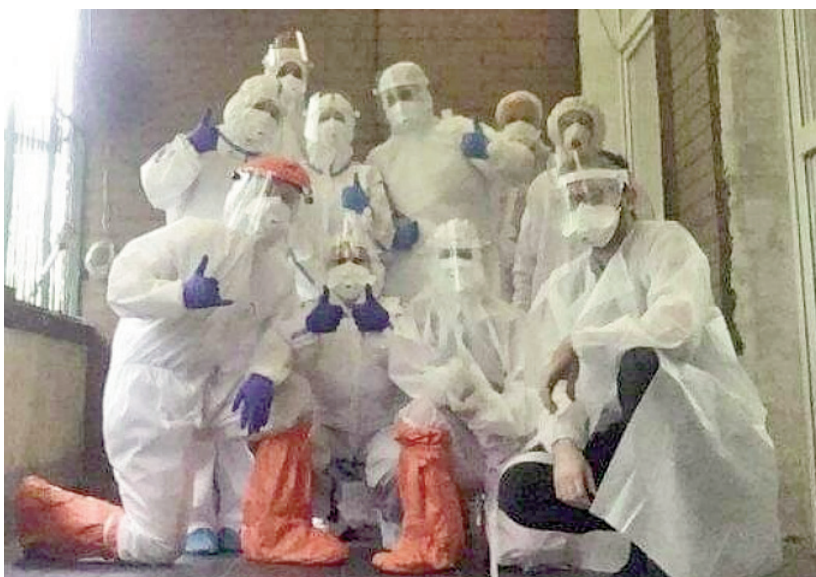
O sytuacji w Niebieskim Parasolu