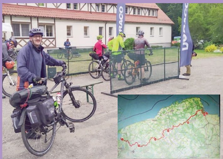
Na rowerze dzień i noc... - Pomorska 500