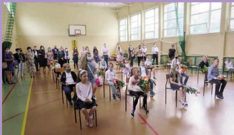
Zakończenie roku szkolnego SP 3

- wotum zaufania i absolutorium dla burmistrza