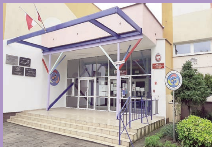
„Czwórka - kolorowa szkoła”