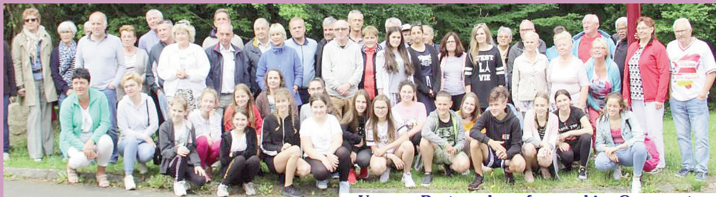
Umowę Partnerską z francuskim Commentry podpisano 20 sierpnia 2005 roku