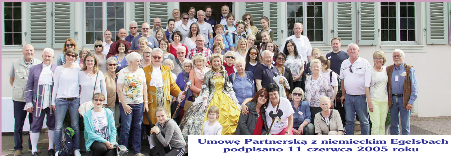
Umowę Partnerską z niemieckim Egelsbach podpisano 11 czerwca 2005 roku