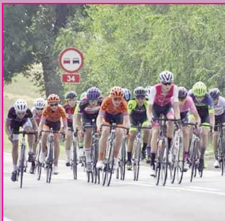
Aktywne wakacje UKKS Oriens Chojnow

Wielkie gratulacje dla Stypendystów i Nagrodzonych!