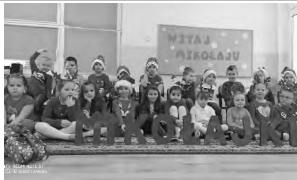
Rada Rodziców Przedszkola Miejskiego nr 3 w Chojnowie

Tym samym zachęcamy rodziców do wpłat na konto Rady Rodziców, aby dzieci mogły poczuć magię prezentów nie tylko 6 grudnia. Nr konta: 33 8644 0000 0014 5017 2000 0010