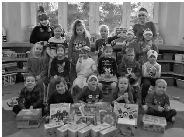
Przedszkole Miejskie nr 1 w Chojnowie