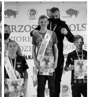
zdj. z Sokółki