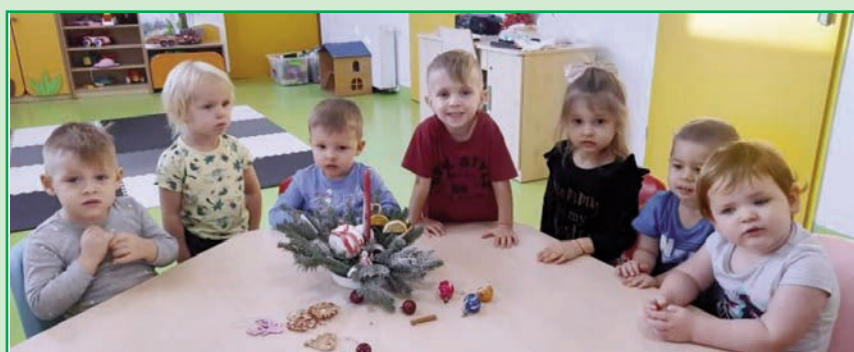
Święta Bożego Narodzenia w Żłobku i Przedszkolach