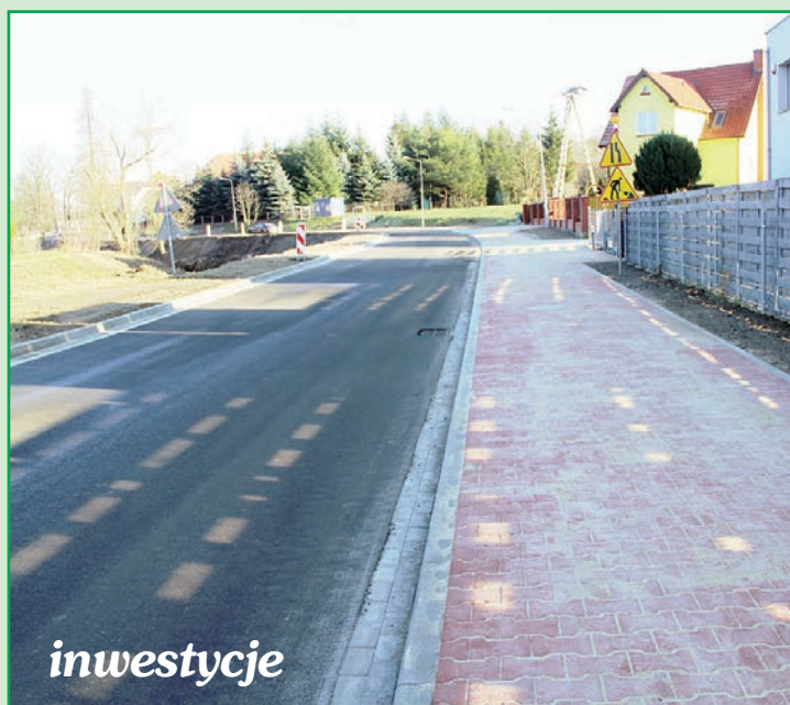
Modernizacja ulicy Asnyka