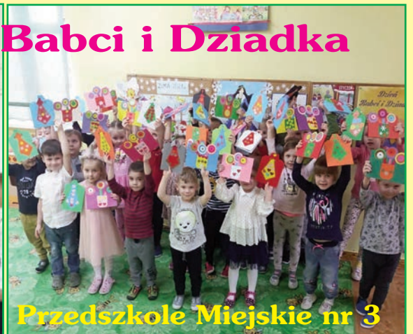
Przedszkole Miejskie nr 3