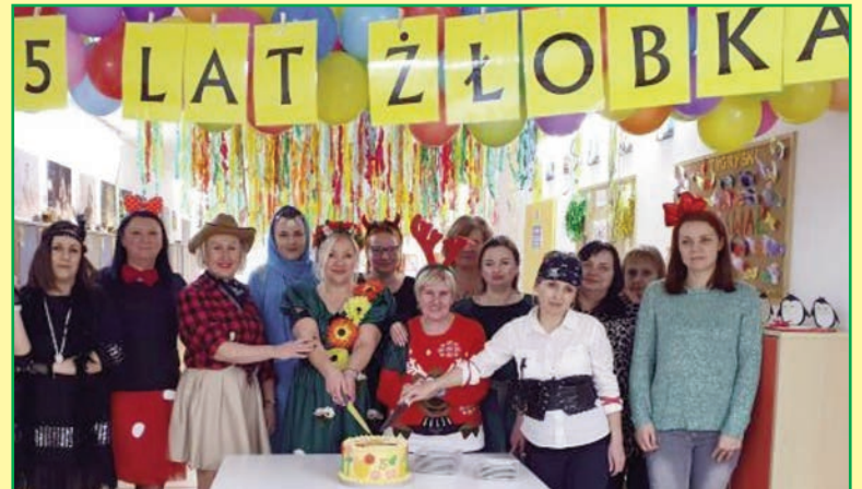
Żłobek ma już 5 lat...