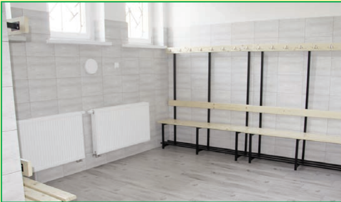
Zaplecze hali sportowej po modernizacji