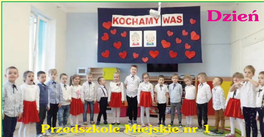
Przedszkole Miejskie nr 1