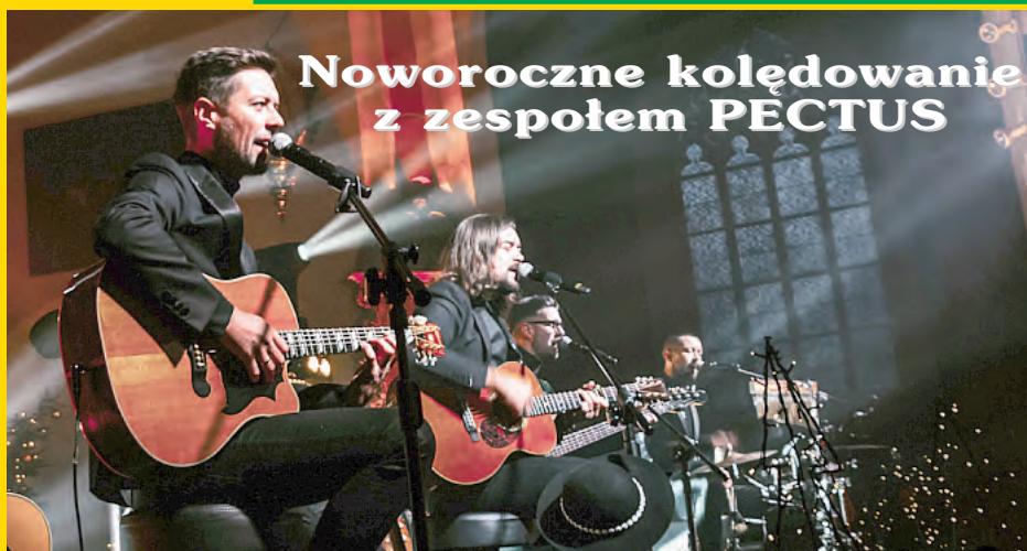
Noworoczne koledowanie z zespołem PECTUS