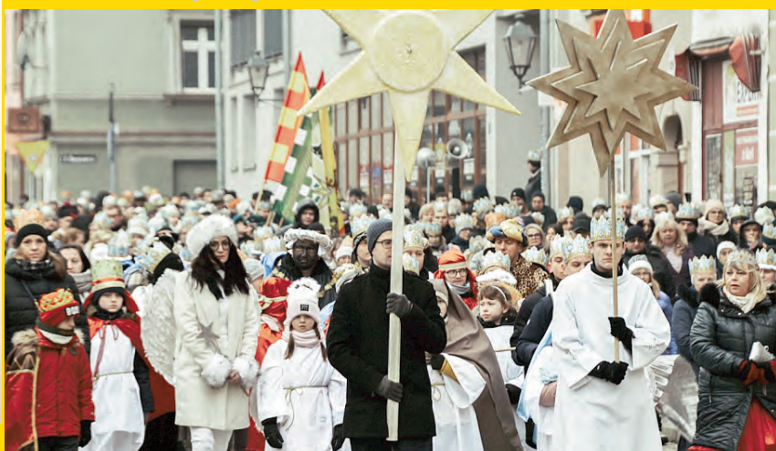
Orszak Trzech Króli