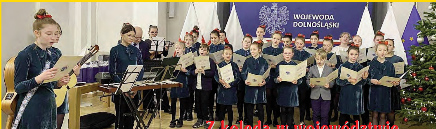
Z koledą w województwie