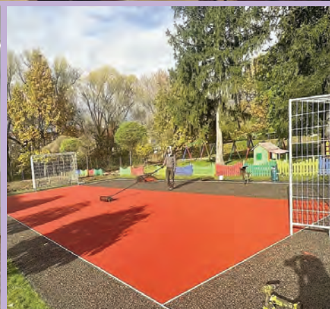
Inwestycje w mieście