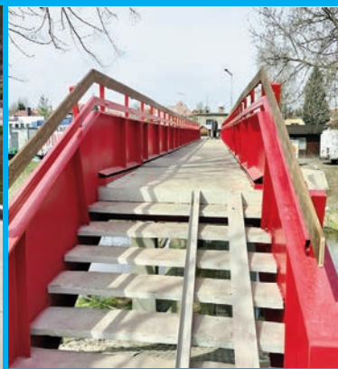
Inwestycje i remonty w mieście