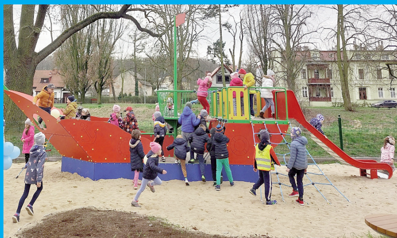
Integracyjny plac zabaw