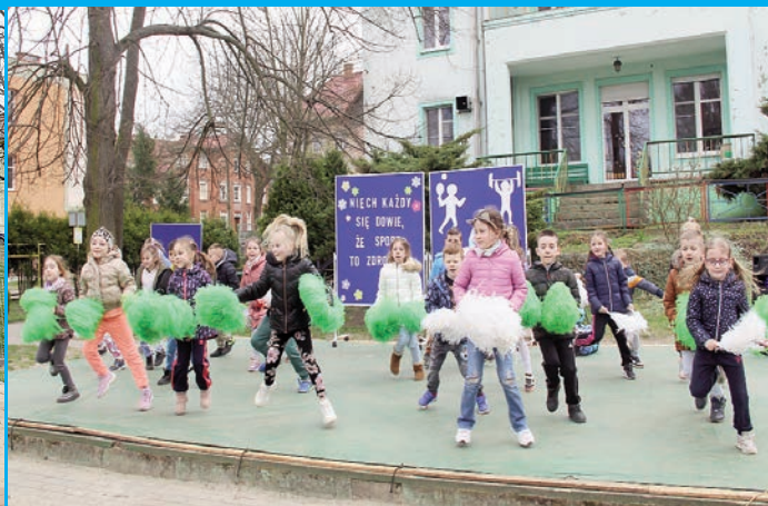
Kolorowe, bezpieczne, nowoczesne - otwarcie boiska w Przedszkolu Miejskim nr 1