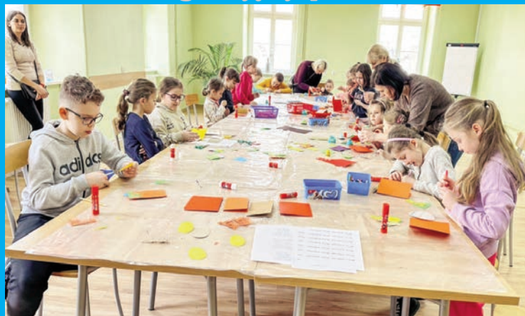
Warsztaty świąteczne w MBP