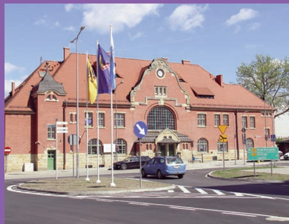
Skrzyżowanie przy Pl. Dworcowym już otwarte