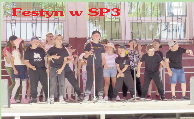
Festyn w SP3