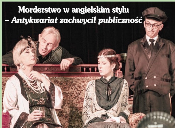
Morderstwo w angielskim stylu - Antykwariat zachwycił publiczność