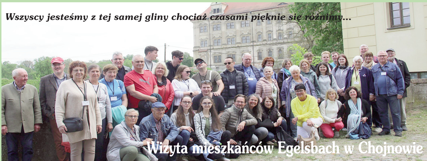
Wizyta mieszkańców Egelsbach w Chojnowie