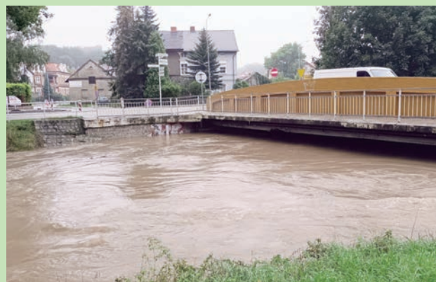
Skora w Chojnowie