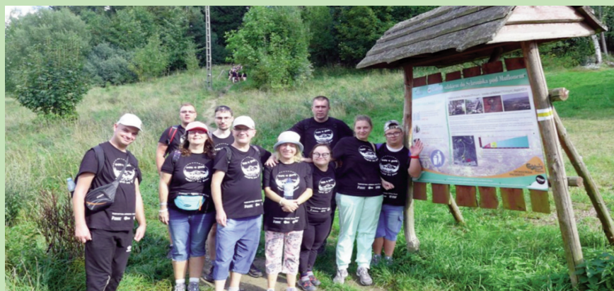
W WTZ dynamicznie po wakacjach