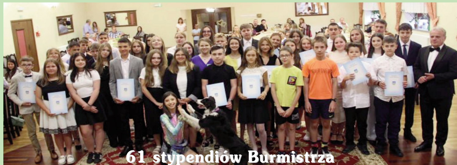
61 stypendiów Burmistrza